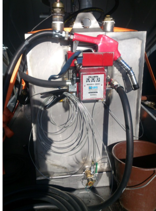
TANKEN PLACERAD PÅ SLÄPVAGN MED KÅPA KÅPAN STÄNGS EFTER TANKNING OCH HAKARNA LÅSES PÅ SIDORNA